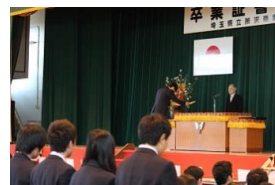
卒業証書を授与される卒業生

当日は好天に恵まれただけでなく、多くのご来賓の方々と保護者の皆様にもお越し頂き、とても良い卒業式となりました。卒業生のみなさんの今後の活躍を心から期待しています。