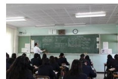
商業の授業の様子

3学期は多くの検定試験があり、1・2月には簿記・情報処理・商業経済検定が行われました。12月下旬の商業特訓(検定を目標に商業の授業のみを集中して行う期間)のほかにも、連日補習が行われました。多くの生徒がいろいろな資格に挑戦し、合格を勝ち取りました。