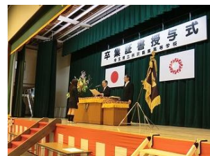
卒業証書を授与される卒業生

入学前の3月に東日本大震災があり、日本中がまだ混乱している中、私たちは、高校1年生となりました。この震災で私たちは人と人との“絆”の大切さを再認識しました。その余韻が残っている中で過ごした高校生活は色々なことがあり色々な思いの詰まった3年間となりました。(中略)今日までこの校舎で過ごし、学んだことや先生や友人先輩後輩など多くのかげがいのない人たちに出会えたことは決して忘れません。またそれをこれからの人生に活かして、この時代を生き抜き若い力で社会を支えていきたいと思っています。