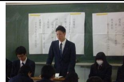
1学年校内ガイダンス

2年生では、進路ガイダンス、進路LHR、面接指導、などが立て続けに行われました。1年生でも校内ガイダンスが行われ、進路が決定した3年生からのアドバイスがありました。