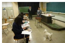
2学年 専門学校の講師を迎えての進学・就職ガイダンス