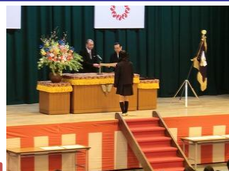
卒業証書を授与される卒業生

時が経つのは早いもので、新しい制服に身を包み、期待と不安を胸に抱いてこの所沢商業高校に入学してから、はや三年が経とうとしています。最初は初めて学ぶ商業科目に戸惑いましたが、時間が経つにつれて学校生活にも慣れていきました。そして授業や部活動などを通して多くのかげがえのない友人をつくる事が出来ました。(中略)卒業してからは社会人としての自覚を持ち、今日まで友達とこの学舎で過ごしたこと、学んだこと、出会えたことを忘れずに、これからの人生に生かして頑張っていきたいと思います。