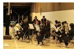
入退場の曲を演奏する吹奏楽部