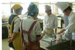
2学年 専門学校の講師を迎えての進学・就職ガイダンス