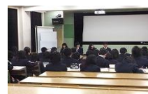
1学年校内ガイダンス

2年生では、進路ガイダンス、進路LHR、面接指導、などが立て続けに行われました。1年生でも校内ガイダンスが行われ、進路が決定した3年生からのアドバイスがありました。