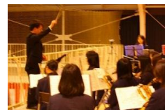
→入退場の曲を演奏する吹奏楽部