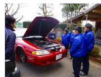
2学年 専門学校の講師を迎えての進学・就職ガイダンス

2年生では、進路ガイダンス、進路LHR、面接指導、などが立て続けに行われました。1年生でも校内ガイダンスが行われ、進路が決定した3年生からのアドバイスがありました。