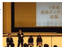
1学年 校内ガイダンス