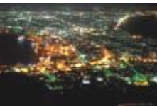
雨上がりでキラキラと一際美しかった函館の夜景