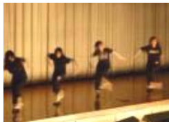
発表部門1位のダンス部