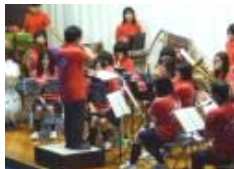
趣向を凝らした吹奏楽部