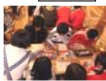
ジェルキャンドル作り