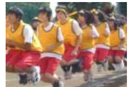
息のあった大縄飛び