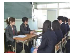
2学年 卒業生を迎えての進学・就職ガイダンス

2年生では、進路ガイダンス、進路LHR、面接指導、などが立て続けに行われました。1年生でも校内ガイダンスが行われ、進路が決定した3年生からもアドバイスがありました。