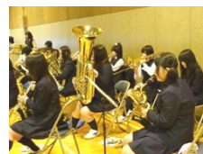
→入退場の曲を演奏する吹奏楽部

不況の影響もあり、就職を考えていた人はとくに不安な気持ちを抱えて活動していたと思います。そんな時に先生方は時に厳しく、時には優しく指導していただき、親身になって相談にも乗っていただきました。・・・私たち卒業生は、この所沢商業高校を誇りに思います。これまでの歴代の先輩方が築き上げてきた伝統を受け継ぎ、今こうして卒業を迎えることができたことは、私たちにとって大きな自信となって胸に刻み込まれています。この先、多くの困難が待ち受けているのだろうと思います。しかし、今日までこの校舎で学んだこと、過ごしたこと、出会えたことを忘れずにこれからの人生に活かして頑張っていきたいと思えます。