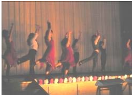
衣装も様々なダンス部