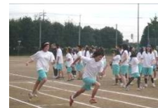
声援を受けて精一杯走りました。