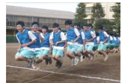
息のあった大縄飛び