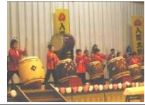
入間太鼓のみなさん。迫力のある演奏でした。