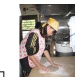
そば打ち、かから団子作り、押し寿司作り、和太鼓などの体験学習