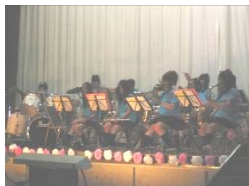
趣向を凝らした吹奏楽部