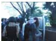
前期募集は1.66倍の倍率でした。

2月10日に前期募集の合格発表があり、156名の生徒が合格しました。また、3月6日の後期募集の発表では、82名の生徒が合格しました。