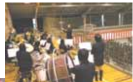
入退場の曲を演奏する吹奏楽部

部活動と勉強の両立、定期考査や各種検定試験の勉強などは、本当につらい思い出です。---三年生になってからは特に進路決定とその準備で忙しくなり、悩んだりすることも多くありました。そんな中、時には厳しく、時には優しく、親身になって指導して下さったのは先生方でした。今日、こうしてこの式に出席することができるのも、先生方のおかげです。--- また、私たちが無事三年間を終了し、ここまで大きく成長することができたのは、いつでも温かく支えてくれた家族のおかげでもあります。---所商は素晴らしい先輩方のおかげで、伝統によって支えられているということ、今は実感しています。