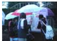
後期募集 雨の中、喜びの音が響きました。