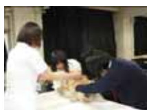
専門学校講師による模擬授業

2年生では、進路ガイダンス、進路LHR、面接指導、などが立て続けに行われました。4月からは、またそれぞれの進路実現に向けての取り組みが本格化します。