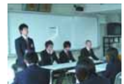
卒業生を迎えての進学・就職ガイダンス